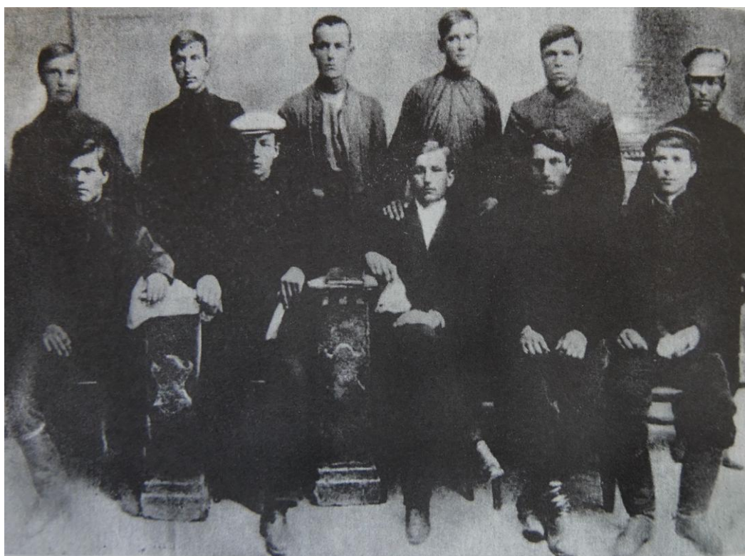
Η Ομάδα Αναρχικών του Γκουλάι Πόλε. Όρθιοι: Α. Σεμενιούτα, Λ. Κραφτσένκο (Γκραμποβόι), Ι. Σεφτσένκο, Π. Σεμενιούτα, Ε. Μπονταρένκο, Ι. Λεβάντι. Καθιστοί: Ν. Μαχνό, Β. Αντονί, Π. Ονισένκο, Ν. Ζουιτσένκο, Λ. Κοροσίλεφ. 1909.