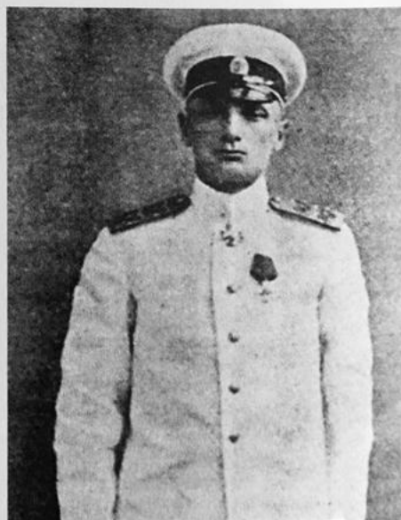
Ο ναύαρχος Κολτσάκ.