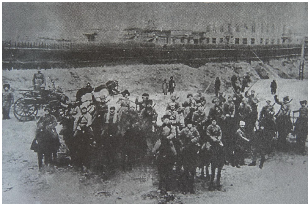
Η προσωπική εκατονταρχία του μπάτκο Μαχνό.