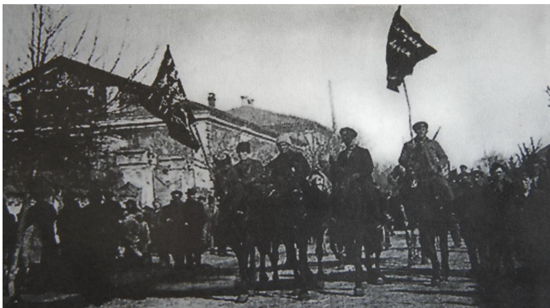
Η είσοδος των μαχνοβιτών στο Μπερντιάνσκ.