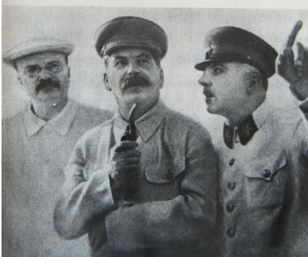
Μόλοτοφ, Στάλιν, Βοροσίλοφ την εποχή των σταλινικών εκκαθαρίσεων.