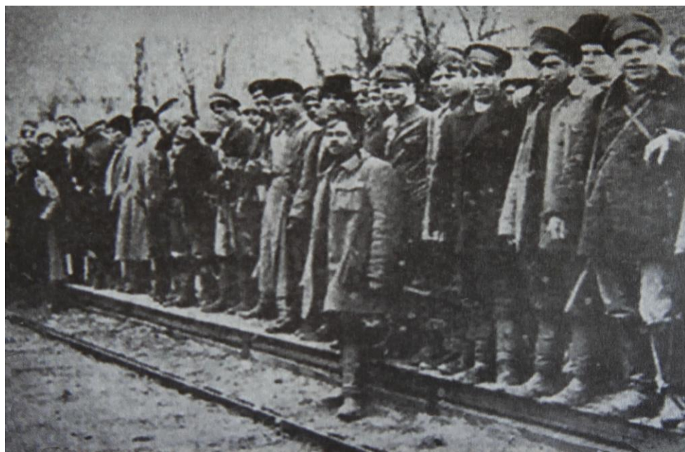
Απόσπασμα μαχνοβιτών στον σιδηροδρομικό σταθμό Πολόγκι.