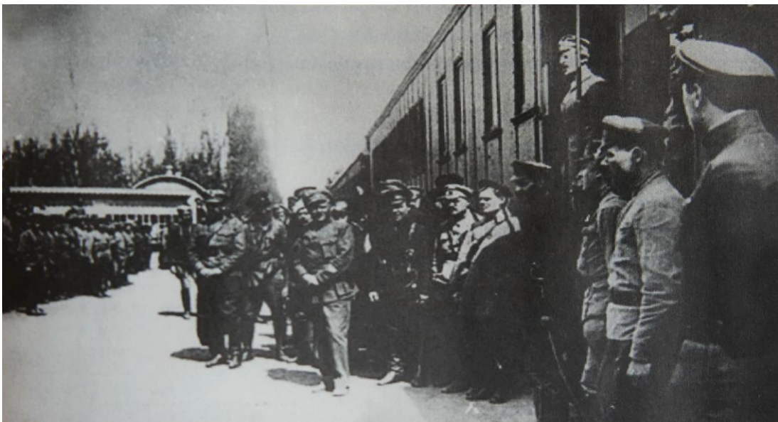
Ομιλία του αταμάνου Γκριγκόριεφ στους άντρες του, 1919. Δεξιά στα σκαλάκια του βαγονιού διακρίνεται ο Αντόνοφ-Οφσέγιενκο.