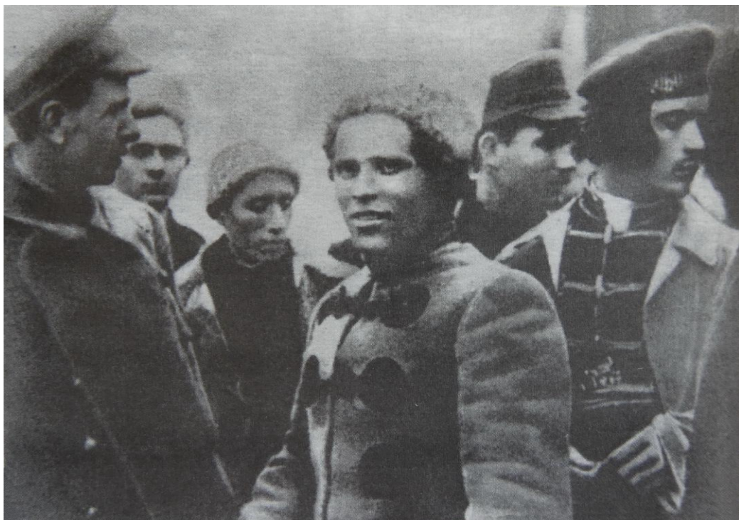
Οι αντάρτες συζητούν με τον μπάτκο Μαχνό. Σε πρώτο πλάνο: Πετρόφ, Γ. Γκόρεφ, Ν. Μαχνό, Φ. Σιους, 1919.