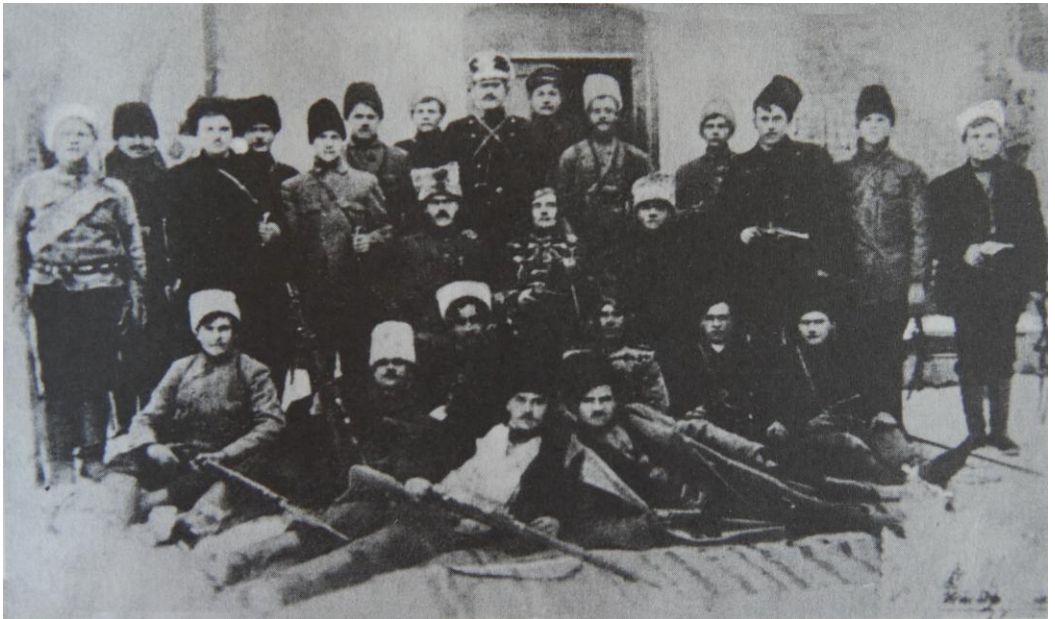
Το απόσπασμα του Ντιμπρίφκι (Μπολσάγια Μιχάιλοφκα) υπό τη διοίκηση του Σιους που βρίσκεται στο κέντρο της φωτογραφίας.