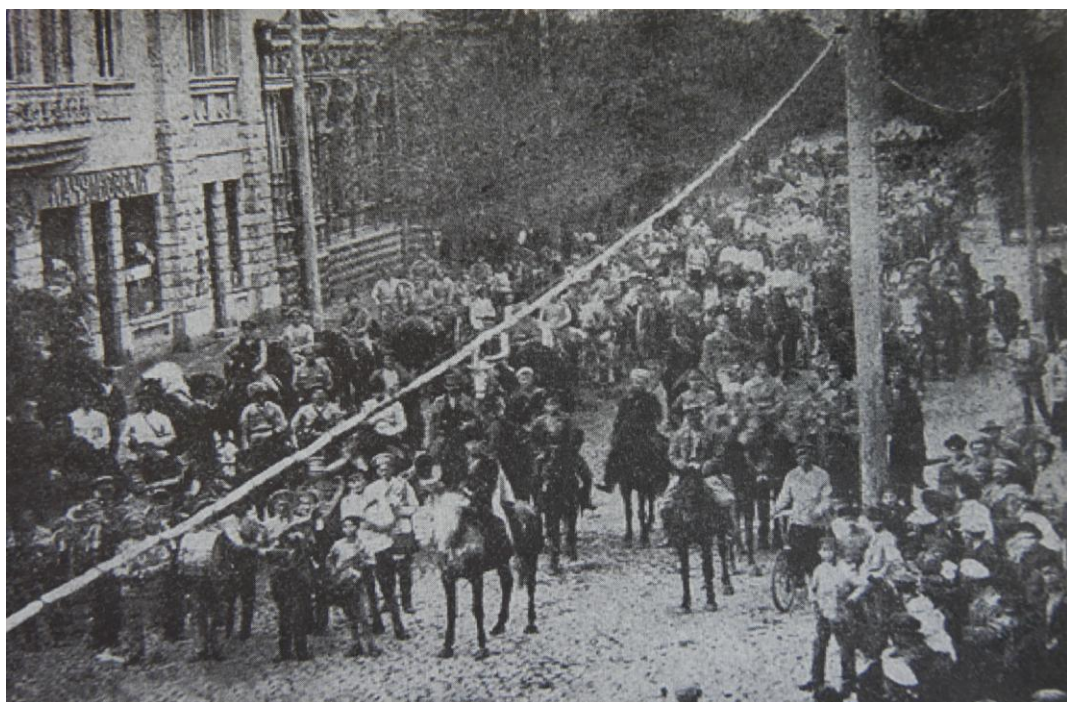
Το απόσπασμα του Πολόνσκι στο Γκουλάι Πόλε.