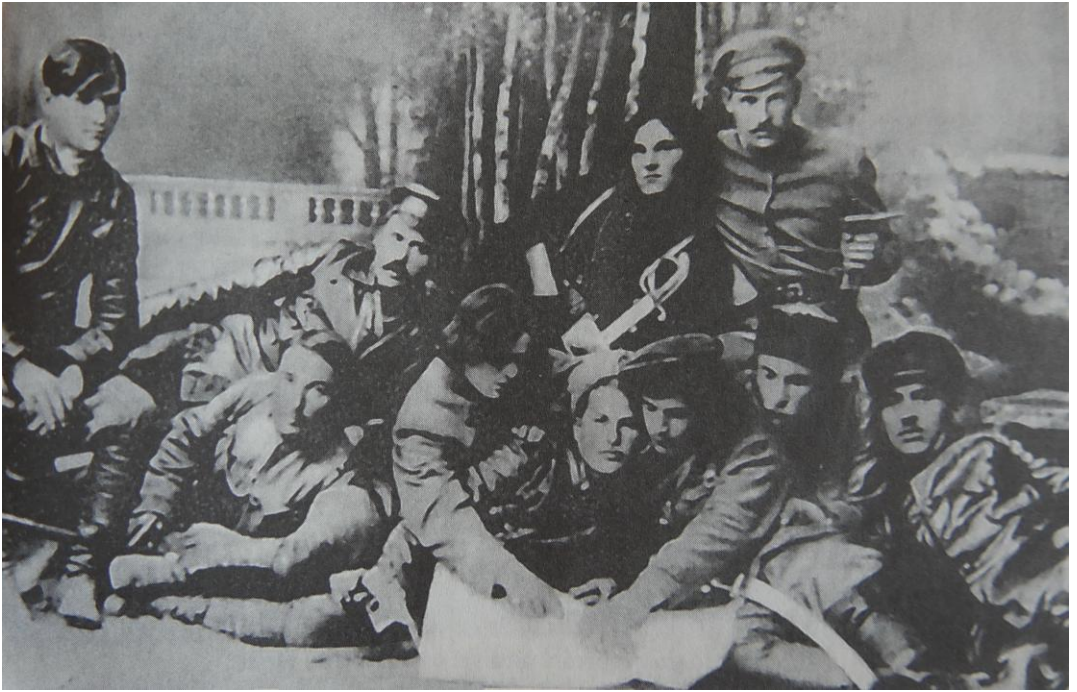
Ο Μαχνό ανάμεσα σε διοικητές αντάρτες. Από αριστερά προς τα δεξιά: Πρώτη σειρά, Ι. Λιούτι, Π. Μπελοτσούμπ, Ν. Μαχνό. Β. Κουριλένκο, Φ. Σιους, Ιά. Οζέροφ, Α. Τσουμπένκο. Δεύτερη σειρά, Α. Όλχοβικ, Π. Πουζάνοφ, Νόβικοφ. 1919, Μπερντιάνσκ.