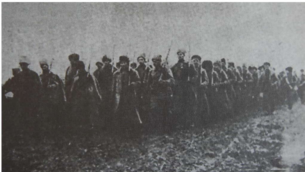
Απόσπασμα μαχνοβιτών μπαίνει στο Γκουλάι Πόλε.