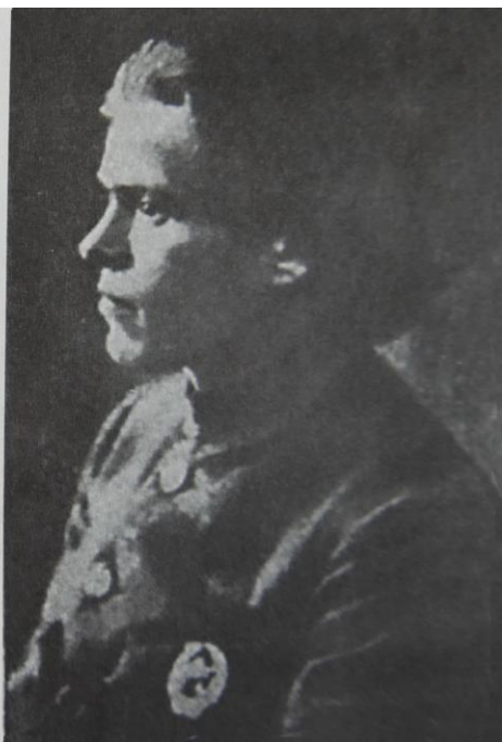
Ο Νέστορ Μαχνό με το παράσημο του Κόκκινου Λαβάρου στο στήθος, 1919.