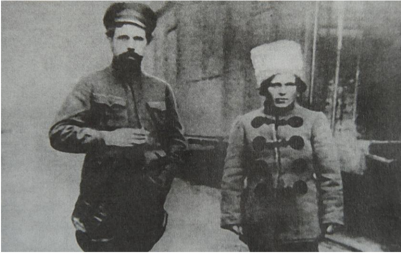
Ο Διοικητής της Μερραρχίας του Ζαντνεπρόφσκ, Ντιμπένκο και ο Διοικητής Ταξιαρχίας Ν. Μαχνό.