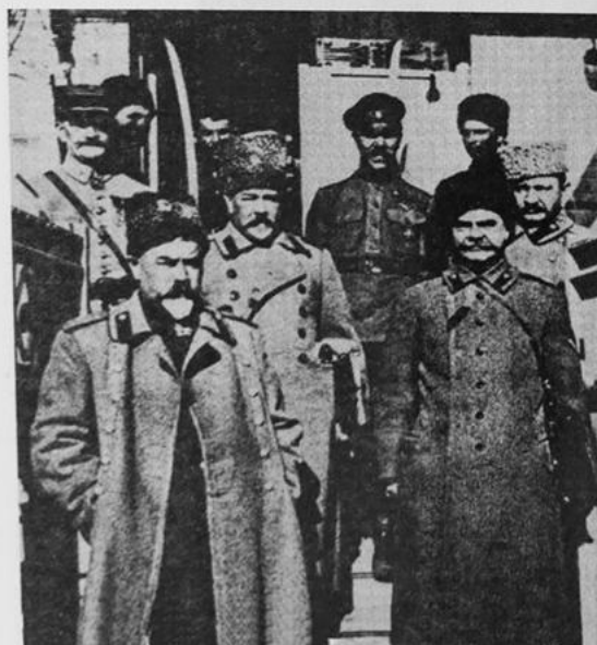
Από αριστερά προς τα δεξιά: οι στρατηγοί Ντενίκιν, Λούκομσκι, Ντραγκομίροφ και Ρομανόφσκι. Πίσω τους Γάλλοι αντιπρόσωποι, ο πλοίαρχος Φουκέ και ο συνταγματάρχης Σαπρόν ντε Λαρέ.