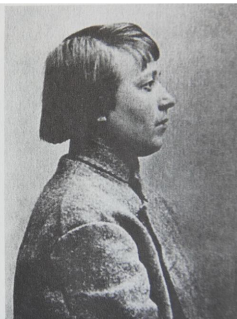
Η περιβόητη Μαρούσια Νικιφόροβα.