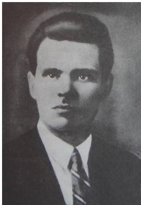
Νέστορ Μαχνό, 1909.