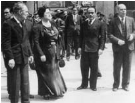
6. Στιγμές ντροπής. Στο κέντρο της φωτογραφίας οι αναρχικοί υπουργοί Φεδερίκα Μοντσένυ και Χουάν Γκαρθία Ολιβέρ. Στα αριστερά τους ο Αρτέμι Αϊγουαδέ, πρωταγωνιστής της αντίδρασης κατά τα γεγονότα του Μάη του 1937 στη Βαρκελώνη.