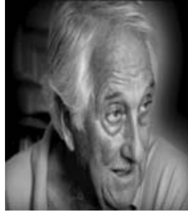
61. Ο Οκτάβιο Αλμπερόλα (1928), μέλος -μεταξύ άλλων- της DI, της Ομάδας 1η Μάη και των GARI. Η συνεισφορά του στο ευρωπαϊκό αναρχικό αντάρτικο πόλης ήταν ιδιαίτερα σημαντική.