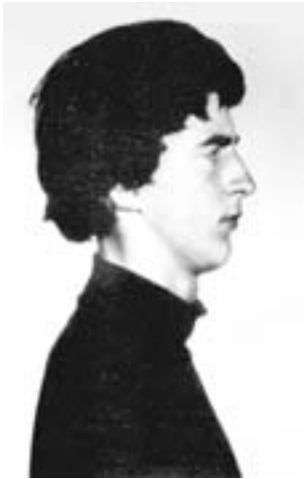
65. Ο Στιούαρτ Κρίστι (1946), γνωστός σκωτσέζος αναρχικός, στη φωτογραφία της σύλληψής του, το 1964, στη Μαδρίτη. Μετά την αποφυλάκισή του το 1967, ο Κρίστι συμμετείχε στην ίδρυση του Αναρχικού Μαύρου Σταυρού και στην Οργανωμένη Ταξιαρχία.