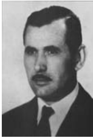
51. Ο Φρανσίσκο Σαμπατέ «Κίκο» (1915-1960), ο γνωστότερος αναρχικός ανάρτης της αντιφρανκικής αντίστασης, σε φωτογραφία του 1946. Δολοφονήθηκε σε συμπλοκή στο Σαν Σελόνι στις 5/1/1960.