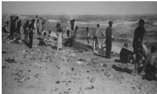
11. Φωτογραφία από το γαλλικό στρατόπεδο συγκέντρωσης προσφύγων στο Αρζελέ, στις 27/2/1939. Οι ανύπαρκτες υποδομές ανάγκασαν πάνω από 100.000 πρόσφυγες, που ζούσαν κλεισμένοι σε ελάχιστα στρέμματα παραλίας, να χρησιμοποιούν για την προσωπική τους υγιεινή τη θάλασσα.