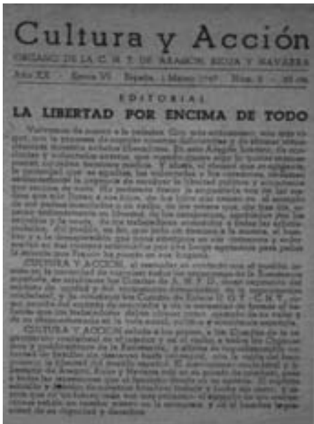
21. Η εφημερίδα Cultura y Acción, έντυπο της περιφερειακής επιτροπής Αραγόνας, Ναβάρρα και Ριόχα. Παράνομο φύλλο, Μάρτης του 1947.