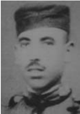
29. Ο Μανουέλ Καστίγιο «Σαλσιπουέδες», αναρχικός καπετάνιος των ανταρτών της Χαέν κατά την περίοδο των φυγάδων. Δολοφονήθηκε σε συμπλοκή στις 10/2/1943.