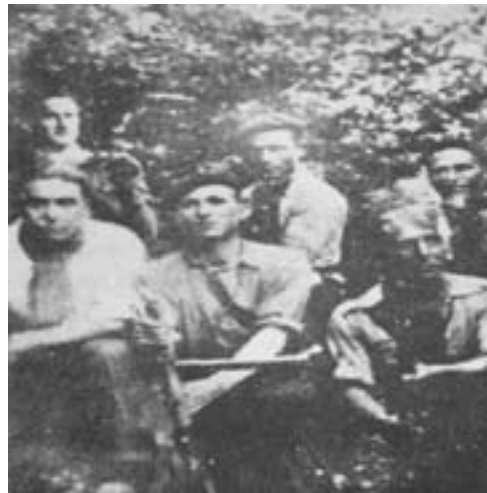
33. Η ανάρτικη ομάδα των Αρίας που έδρασε στη βορειοανατολική Λεόν. Στελεχώθηκε από ανθρακωρύχους της CNT. Μετά τη φυλάκιση ενός μέλους και την εκτέλεση δια στραγγαλισμού άλλων δύο το 1947, οι υπόλοιποι διέφυγαν στη Γαλλία.