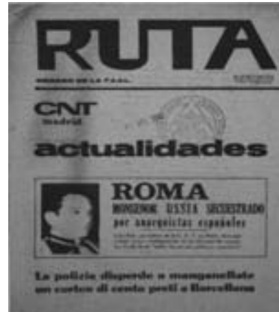
57. Η εφημερίδα Ρούτα της FIJL ανακοινώνει την απαγωγή του Ουσία. Βρυξέλλες 1966.